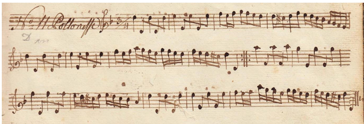
Exempel ur Olof Larssons notbok. En mollversion av en spridd durpolska.

Pris 300 kr för Olof Larssons notbok och 250 kr för Adolf Olofssons.